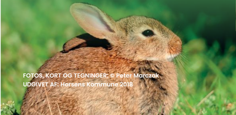
FOTOS, KORT OG TEGNINGER: © Peter Marczak UDGIVET AF: Horsens Kommune 2018

Den europæiske vildkanin er stamfader til tamkaninen, og selv efter mange hundrede års fangenskab, adskiller vildkanin og tamkanin sig ikke væsentligt fra hinanden. Den europæiske vildkanin kommer sandsynligvis oprindeligt fra den liberiske Halvø, hvorfra den har bredt sig til Vest- og Centraleuropa. Danmark og Sydsvrige er nordgrænsen for kaninernes naturlige udbredelse.