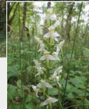
Skov-gøgeilje er knyttet til løvskove og krat