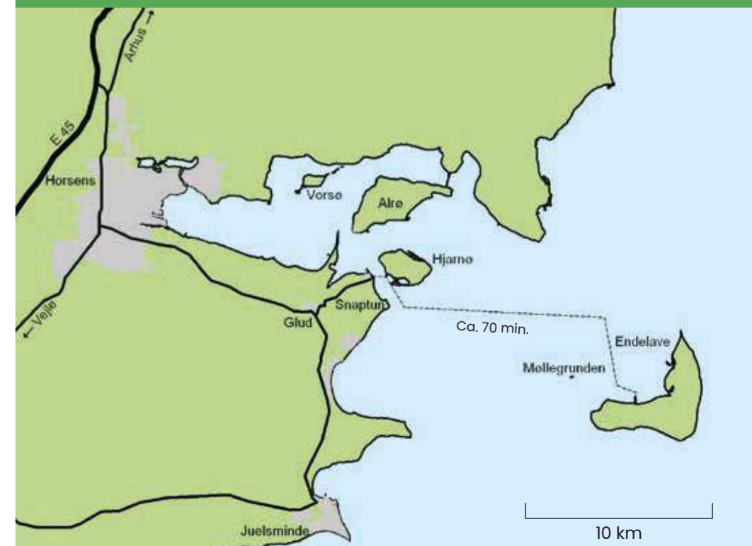
Udvalgte naturtyper og fredede naturområder i Endelave. Billederne er taget fra Horsens, turistbureauet, 1985. Billederne er taget fra Horsens Kommune, Maj 2023. Fredede foto: Copyright All Rights Reserved.

Endelave kan besøges på alle årstider, og øen byder på et væld af flotte vandre- og cykelture i en varieret og uberørt natur. Badevandskvaliteten omkring øen er høj, specielt omkring Øvre og ved Søndermølle.