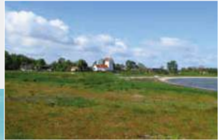
Udsigt til badestrand og kirke.

I byen findes stadig en række butikker og servicefunktioner, der dækker øboernes daglige fornødenheder - købmand, posthus, bibliotek, campingplads og gæstgiveri.